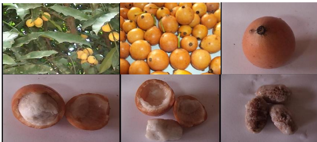
Fruto de Garcinia gardneriana “achachairú”, Chávez et al.